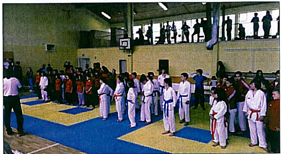
Pripravljene na tekmo