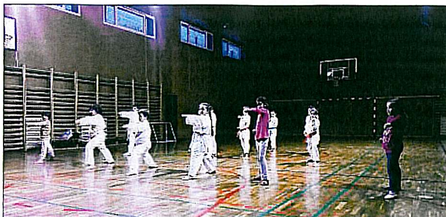
Naši karateisti med treningom