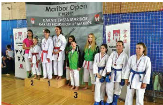
Naša dekleta na zmagovalnih stopničkah